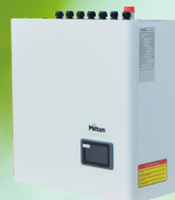
Indedel uden VVB