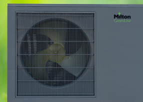
Udedel 6, 9 og 12 kW