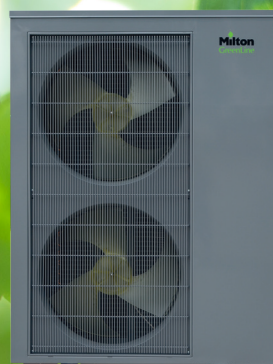
Udedel 15 og 19 kW

Konstruktionen betyder også et yderst lavt lydniveau ned til 52 dB(A) målt efter ErP standarden.